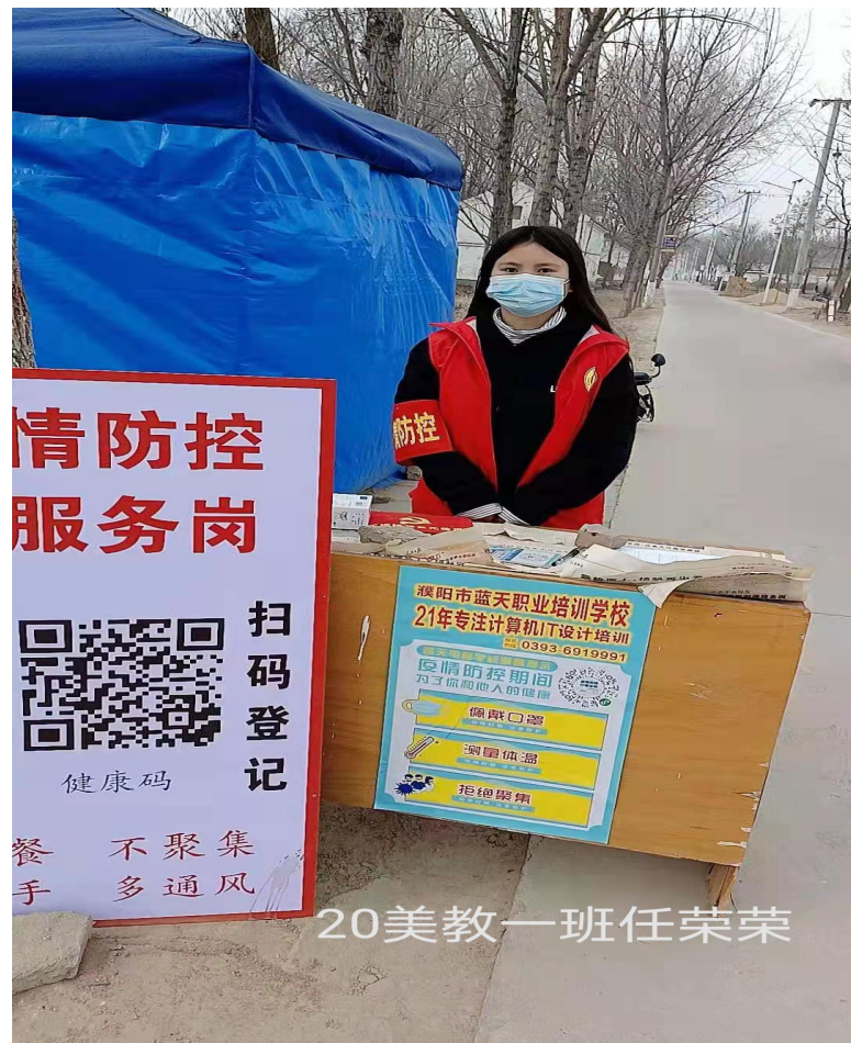
登记相关人员的信息