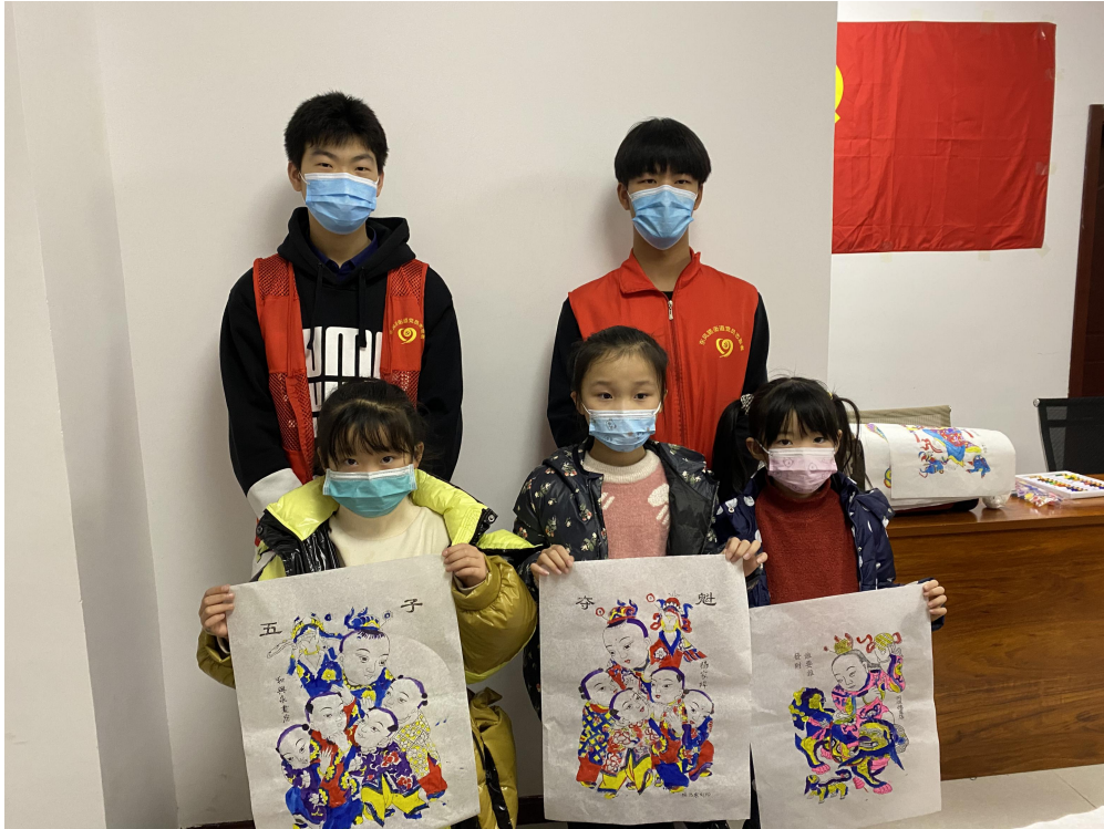
指导孩子们进行年画制作（3）