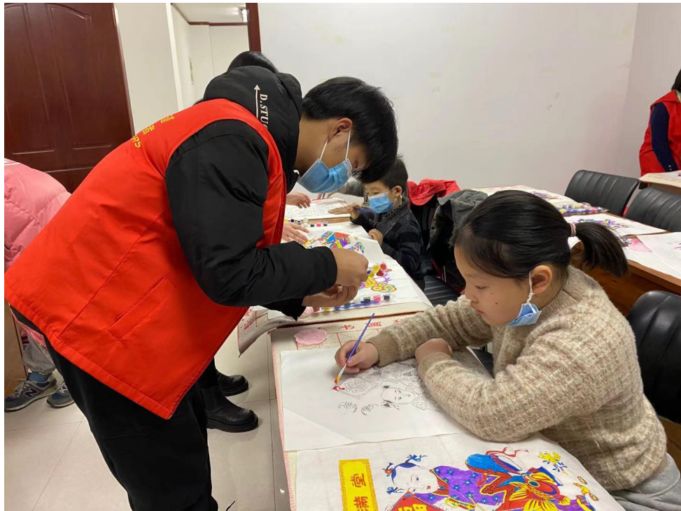
指导孩子们进行年画制作（2）