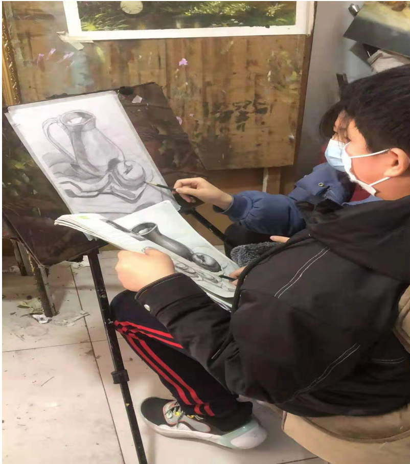
辅导社区小学生进行绘画练习