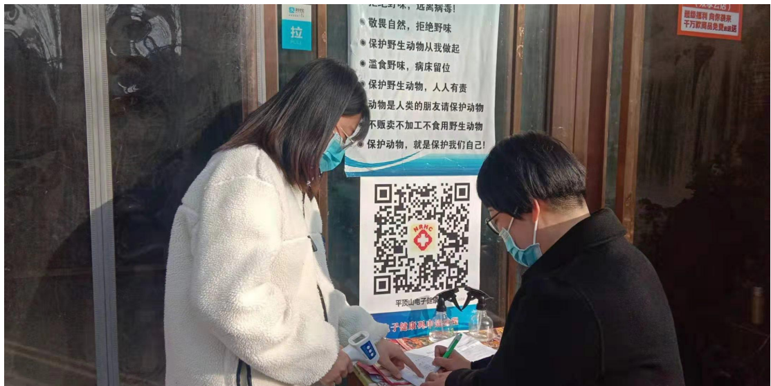
进行外来人员信息登记