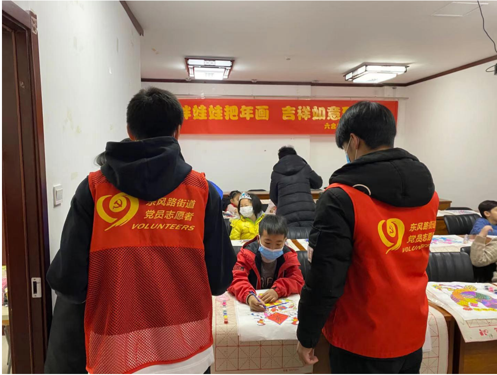
指导孩子们进行年画制作（1）