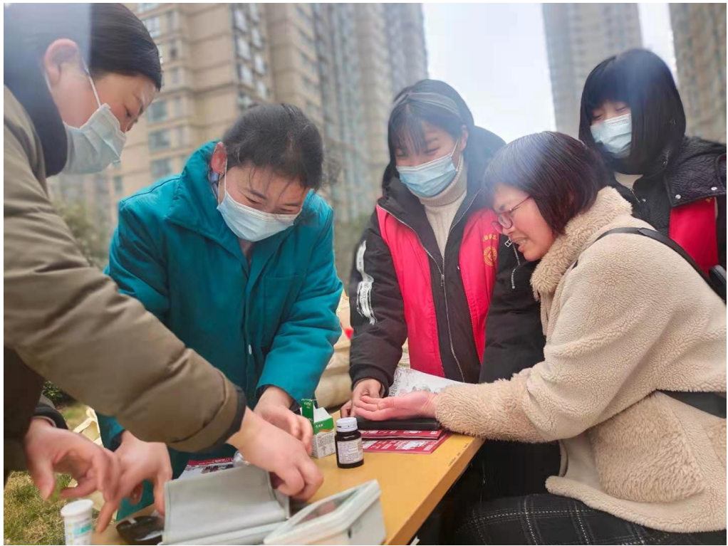
协助医务人员进行居民健康体检