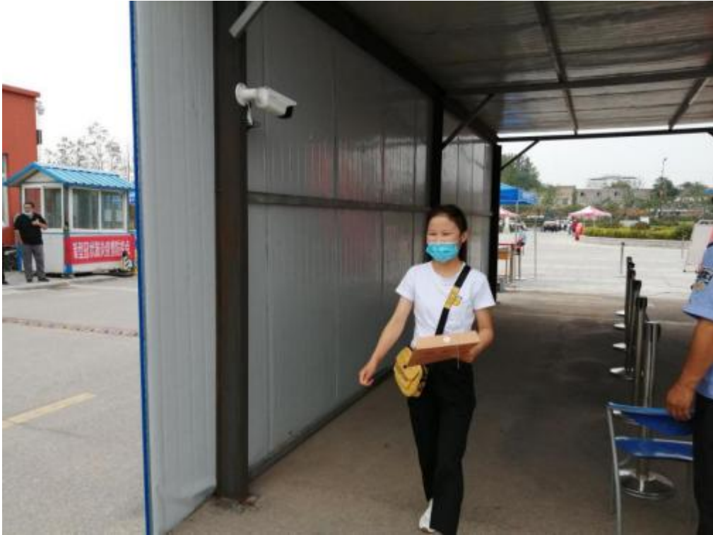
第三步，经过校保卫处审验入校证明和测量体温合格后进入学校。